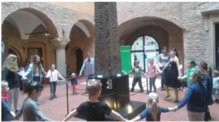
Rodzinny, dzień irlandzki w Muzeum Archeologicznym w Poznaniu