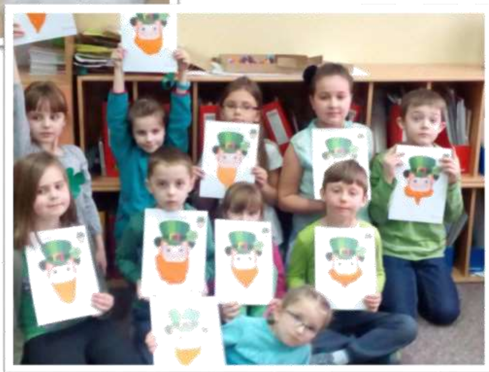
Zdjęcia z obchodów Dnia św. Patryka uczestników projektu Fundacji „Irlandia w szkole”