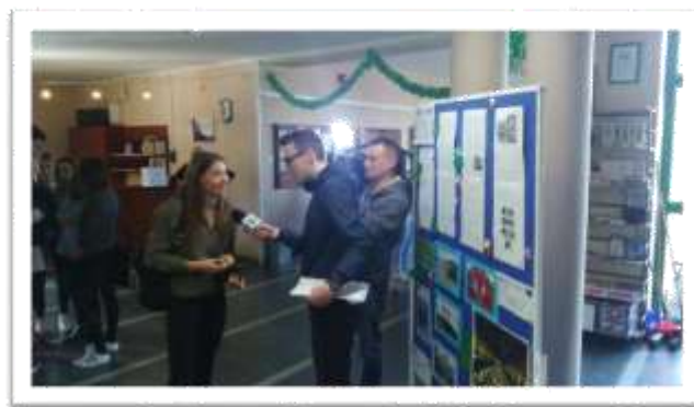
„Muzyczna podróż do Irlandii” - warsztaty muzyczno-taneczne dla uczestników projektu „Irlandia w szkole”, 17 marca 2017.