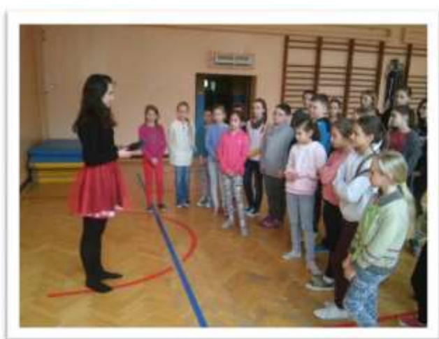
Warsztaty taneczne z instruktorem zespołu Eriu, w szkole podstawowej w Krościenku nad Dunajcem

Szkołom szczególnie zaangażowanym w realizację projektu Fundacja finansowała w okresie Dni św. Patryka warsztaty tańca irlandzkiego. W tym roku zajęcia takie otrzymała między innymi szkoła w Krościenku nad Dunajcem, bardzo aktywny uczestnik projektu „Irlandia w szkole”.